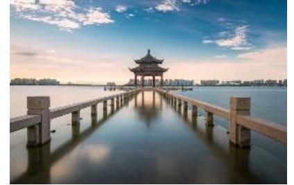
[Jinji Lake Scenic Area]

Day 9 Shanghai ➡ Kuala Lumpur ➡ Kuching (MOB) Flight back home